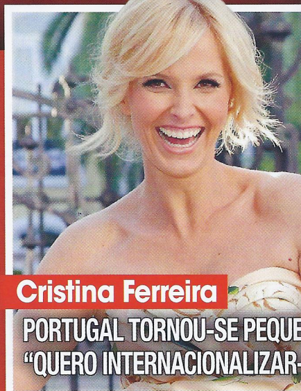
Cristina Ferreira PORTUGAL TORNOU-SE PEQUENO “QUERO INTERNACIONALIZAR”