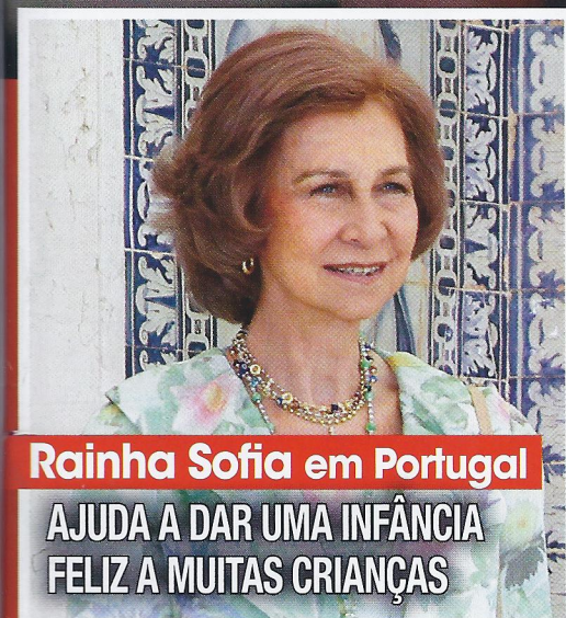
Rainha Sofia em Portugal AJUDA A DAR UMA INFÂNCIA FELIZ A MUITAS CRIANÇAS

ABANDONAM PEÇA DE TEATRO E DEIXAM PRODUÇÃO DESESPERADA FALHAM A ESTREIA ONDE ERAM PROTAGONISTAS PARA ENTRAREM EM SEGREDO NO BIG BROTHER VIP